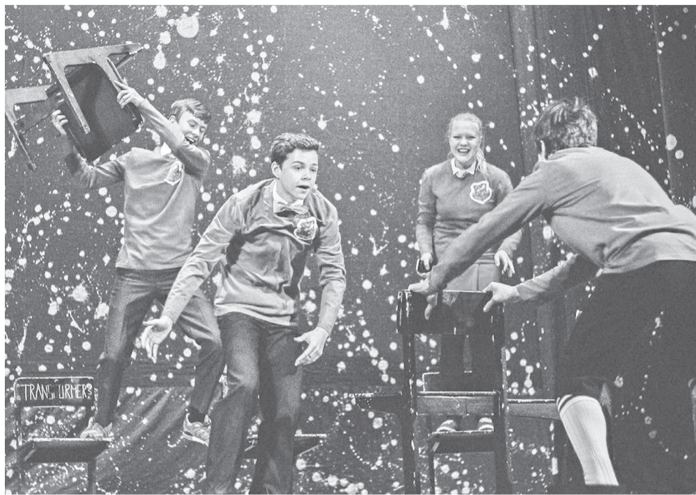
«Великий взрыв» на сцене

В воскресенье, первого ноября, в 18.00 на