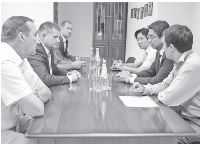
Компания Bridgestone и Ульяновская государственная сельскохозяйственная академия им. П.А. Столыпина готовят квалифицированных специалистов. На это направлено подписанное между академией и японской компанией соглашение. Куратором выступит правительство области.