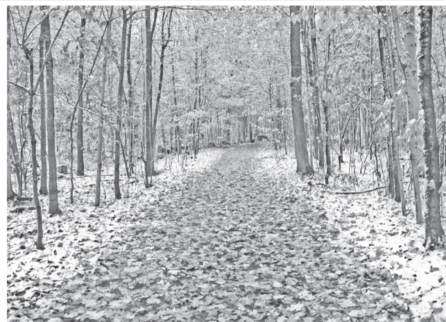
Европейский антициклон накроет область к выходным. Днем похолодает до +1 - 2 градусов. Ночью столбик термометра опустится до -4.