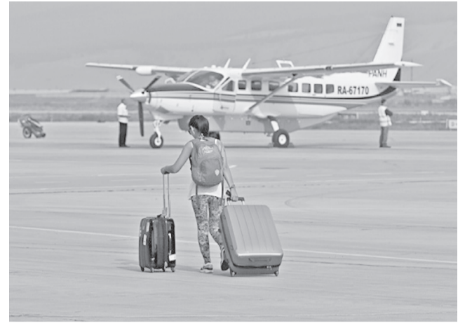
В рамках проекта «Хелипорты России» из Ульяновска в Саратов можно будет долететь на вертолете. Услуга аэротакси обойдется в 135 тысяч рублей, а сам путь продлится 2 часа.