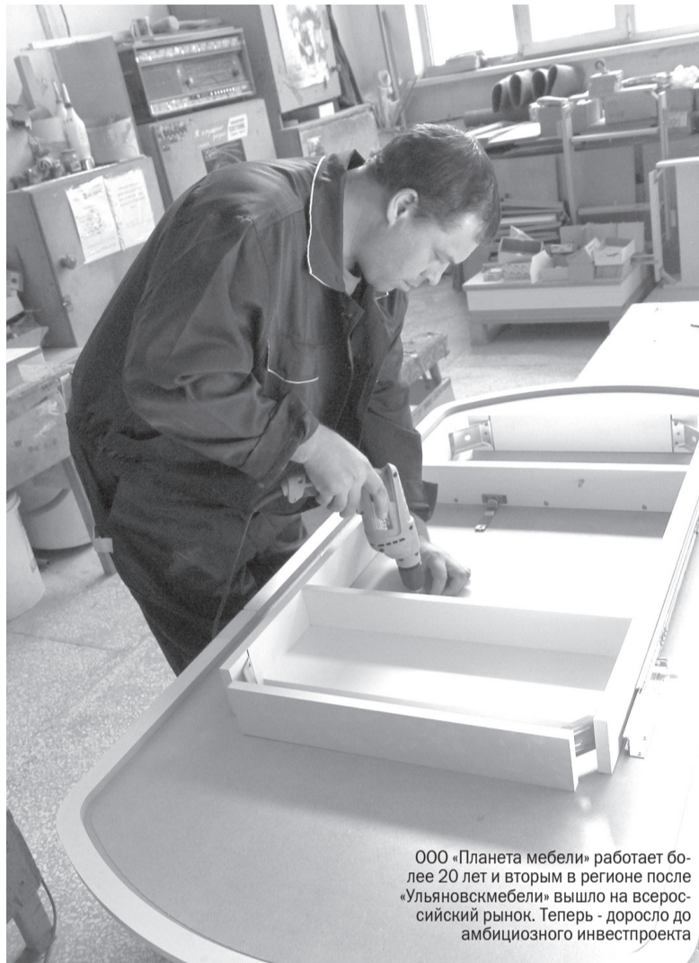
ООО «Планета мебели» работает более 20 лет и вторым в регионе после «Ульяновскмебели» вышло на всероссийский рынок. Теперь - доросло до амбициозного инвестпроекта

Интересно, что представитель генподрядчика - московской фирмы «Профиль АГ» - в ходе заседания сказал: «Сегодня мы ведем строительство объектов в четырех регионах и нигде еще не видели та-