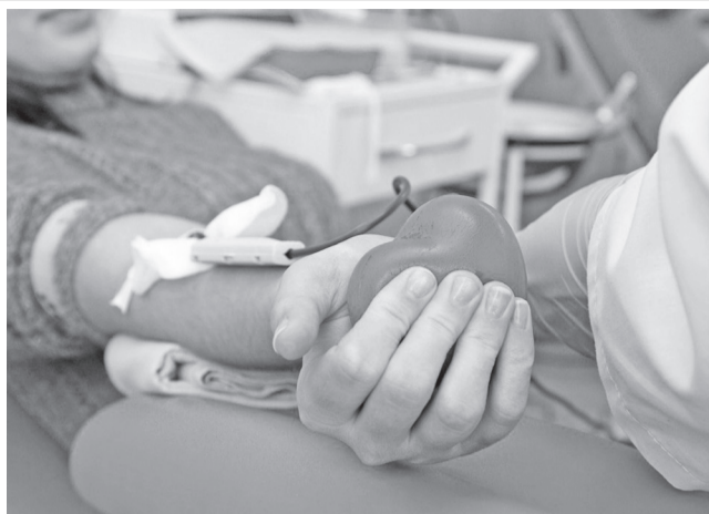
Станция переливания крови (улица III Интернационала, 13/96) 31 октября ждет ульяновцев на последнюю в этом году донорскую субботу с 8.00 до 13.00. Всего за прошедшую неделю донорами стали 770 человек.