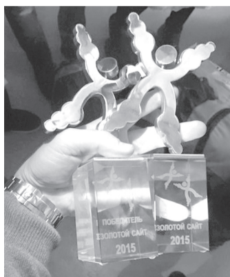
Компания ITECH.group получила на конкурсе сразу две награды

рил список номинаций и состав жюри. В него вошли более 100 экспертов интернет-отрасли и представителей известных российских и мировых компаний. Всего на конкурс было подано более 1600 интернет-проектов, победители определялись в 74 номинациях. Неделю назад, 22 октября, в Москве состоялась церемония награждения призеров и лауреатов.