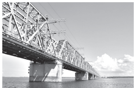
Димитровградского шоссе будут вестись ремонтные дороги. По совету городской администрации, водителям следует сразу ехать через Президентский мост.

1 ноября будет перекрыто движение по Императорскому мосту. С полуночи до четырех утра от спуска Степана Разина до